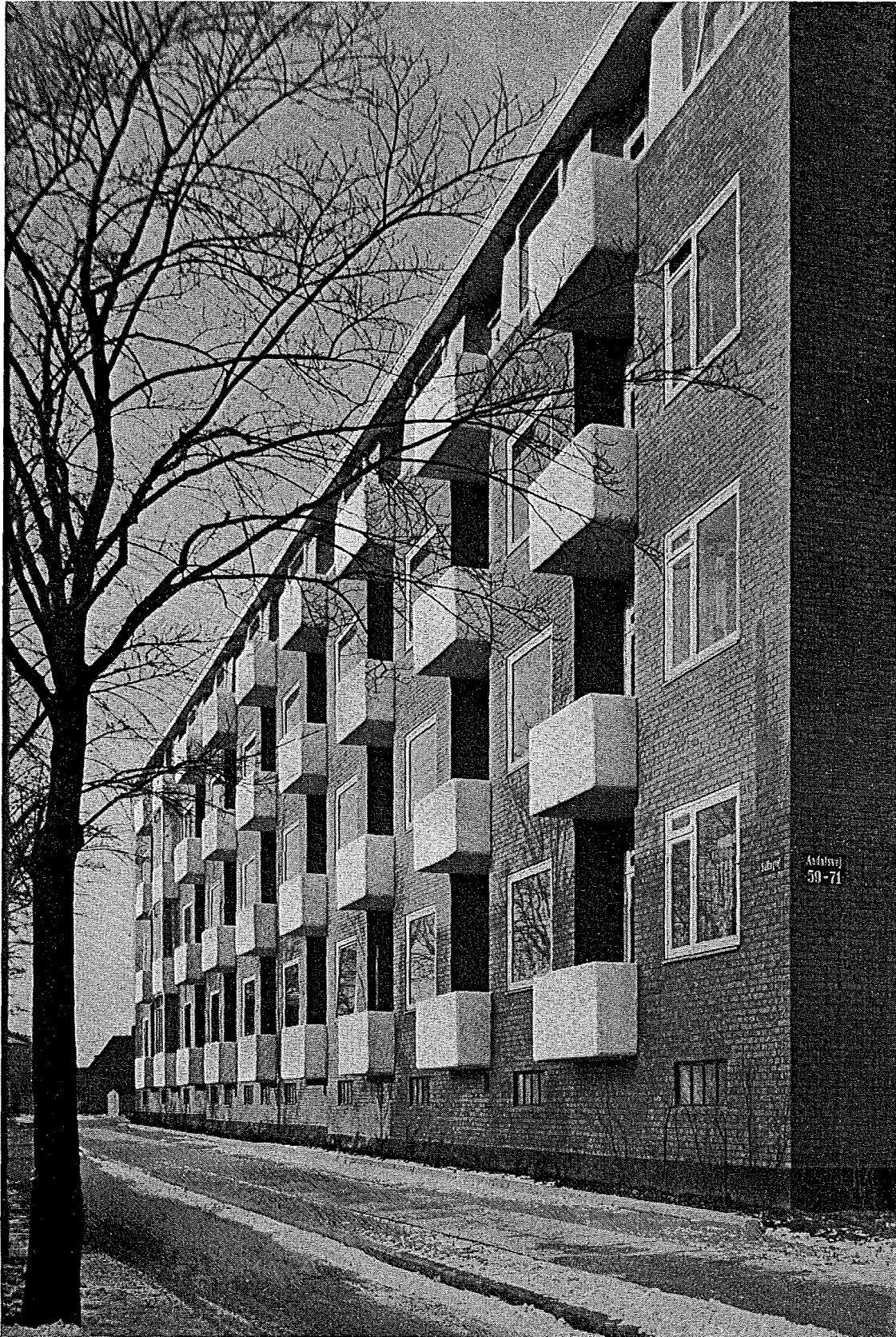
J. Houmøller Klemmensen: Aadalshusene